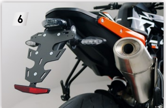
MIZU FLY-Design Kennzeichenträger mit originalen Schrauben montieren Mount license plate holder with original screws